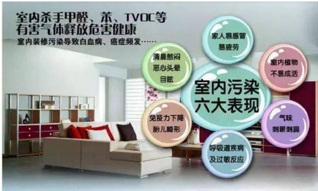
图2 室内污染六大表现