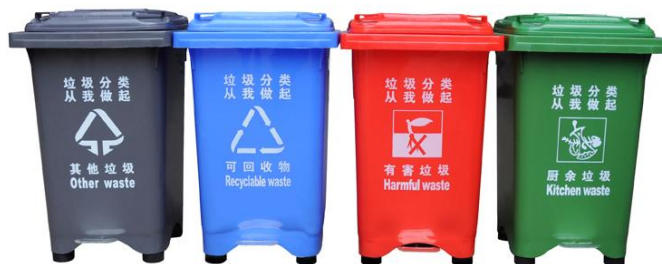
图 1 分类垃圾桶

1.教师在 PPT 上展示分类垃圾桶，如图 1，鼓励学生分享自己在不同场合见到的垃圾桶，并提问（1）：为什么要进行垃圾分类？