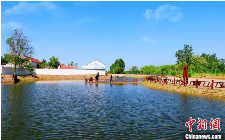
图1 德州庆云县村民在改造后的坑塘垂钓