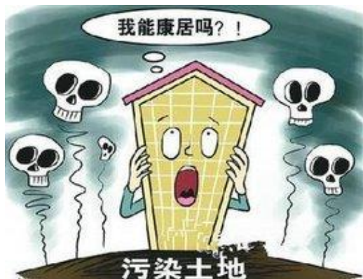
图1 污染土地能康居吗?