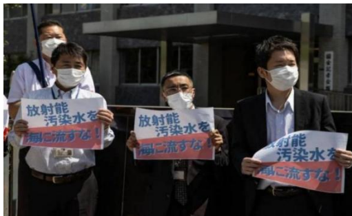
图 1 日本民众反对排放核废水

2.对学生开展排放核污染水对我国和其他周边国家资源环境影响的教育，增强学生的环保责任感和社会使命感。让学生明白只有我们努力建设祖国，增强我国综合实力，才能在国际上拥有话语权，激发学生努力学习的内在动力，为实现中国梦贡献自己的力量。（来自央视新闻）