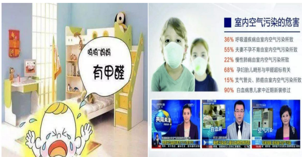
图 1 室内空气污染危害

2.教师明确：我国每年由于室内空气污染引起的急诊数为 430 万人次；每年由室内污染造成的死亡人数达 11.1 万人，平均每天死亡 304 人；每年新增先天残疾儿童总数高达 80 万至 120 万，其中，42.1%与室内空气污染有关，由此增强学生对室内空气质量的重视。