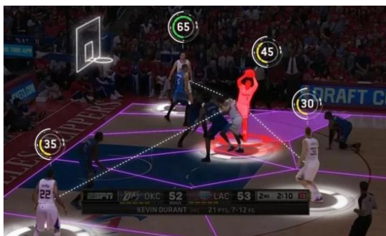
图1 体育行业数字化趋势（来自禹唐体育）