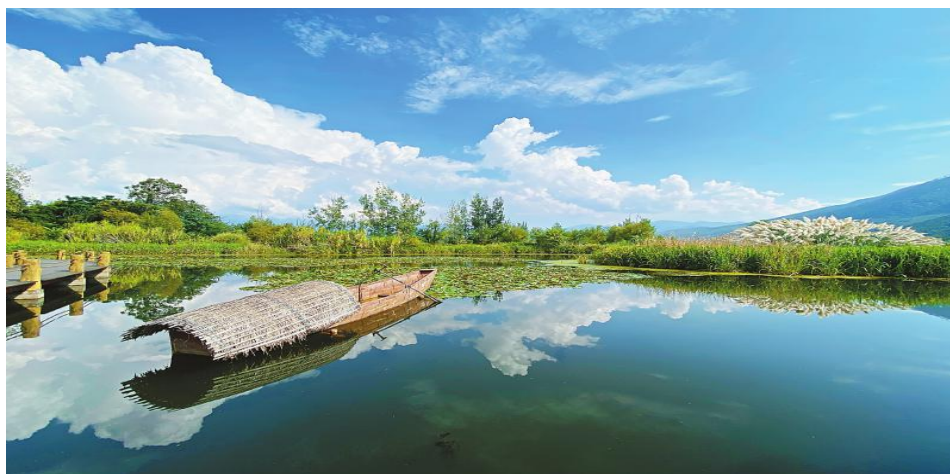
图 2 邛海白鹭滩湿地

教师在讲解完监测断面和采样点设置内容以后，通过图 2 明确：凉山生态环境监测中心站自成立以来常年担负着对邛海水质的生态环境监测，已长达 30 余年之久，是邛海水质预警的“吹哨人”。他们 30 年来持之以恒，对邛海水质的监测从未间断过，无论是寒冬酷暑，还是刮风下雨，都如期在邛海湖面对青龙寺、湖心、邛海宾馆等监测断面，以及邛海主要流域开展采样分析。可以说如今邛海水质的优良状态，凉山生态环境监测技术人员功不可没，进而传递环保人矢志不渝、不抛弃、不放弃的工作精神。（案例来自搜狐网）