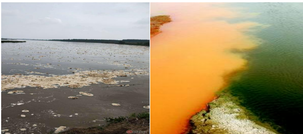
图1 渭河受污染严重