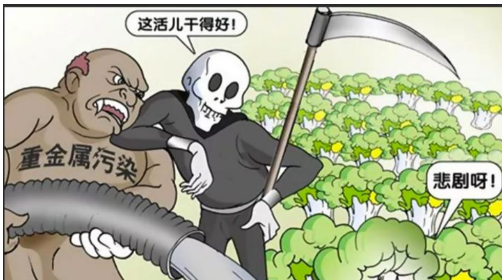
图 1 重金属污染

3.教师明确：重金属在人体内能和蛋白质及各种酶发生强烈的相互作用，使它们失去活性，也可能在人体的某些器官中富集，如果超过人体所能耐受的限度，会造成人体急性中毒、亚急性中毒、慢性中毒，对体会造成很大的危害。日本发生的水俣病（汞污染）和痛痛病（镉污染）等公害病，都是由重金属污染引起的。