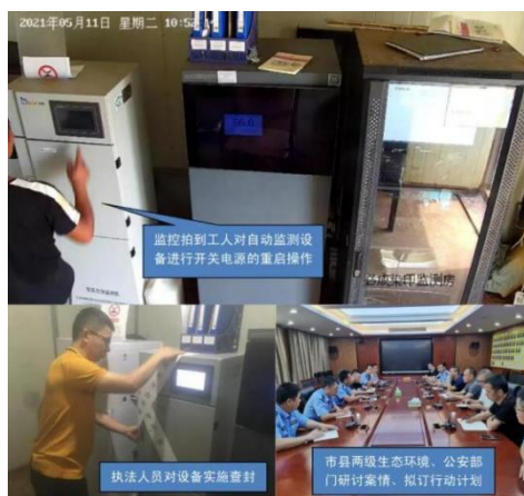
图1 查看监控及执法过程

1.2023年6月,某市生态环境综合行政执法支队在查阅环境自动监测监控系统时发现,某玻璃制品有限公司自动监测数据异常,且该公司是2023年该市重点排污单位。执法人员现场查阅了自动监测站房运维记录、站房视频监控录像以及数采仪参数设置日志,发现自2023年2月起,运维人员每次进行设备校准离开后,均有人员进入自动监测站房操作设备、转动监控摄像头,违规对二氧化硫“高标低校”、违规修改氧含量、氮氧化物等标气浓度参数设置,同时段数采仪日志数据均立即出现二氧化硫、氮氧化物等污染物实测数值急剧下降的现象。经调查,确定该公司员工共14次违规进入自动监测站房修改气体分析仪的设置参数,导致自动监测数据严重失真,根据《环境监测数据弄虚作假行为判定及处理办法》第四条第四项规定,构成篡改自动监测数据、逃避自动监控设施监控的违法行为。