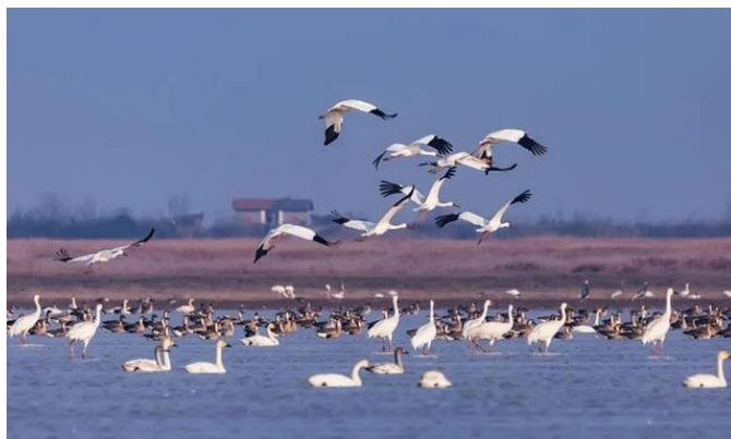
图1 候鸟小镇栖息的候鸟

1.播放完视频，教师带领学生看图1，再次欣赏候鸟小镇美景。讲授吴城半岛的地位，它是鄱阳湖国家级自然保护区外围生态保护的重要补充区域，是研究气候变化和人为干扰对迁徙候鸟影响的良好研究基地。吴城国际候鸟小镇的建设，不仅把江西特有的鸟类资源转化为旅游产业，树立全省乃至全国“观鸟经济”示范，打响世界级“观鸟经济”品牌，更是绿色发展的一次生动实践。通过延伸生态观鸟旅游产业链条，鼓励当地百姓积极参与并从中获益，使得更多的百姓更注重保护生态环境，爱护鸟类，把实现人、鸟、鄱阳湖和谐共处发展推向了又一新高潮。（来自中国新闻网）