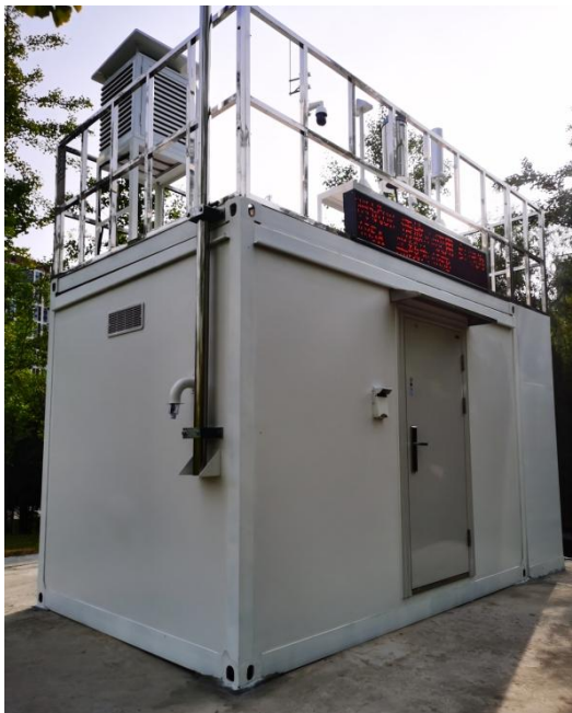
图2 陕西省首座省级辐射环境自动监测站

2.陕西省在西安市中湖公园建设的首座辐射环境自动监测站以国控辐射环境自动监测站建设标准为基准，扩展实现了站房多要素实时监测、多终端远程监控、利用全固态超声波微型气象站动态感知站房周边环境等功能，此类型智能站房在全国尚属首座。陕西省辐射站计划年内在其他设区市陆续建设9座同规格、同型号的省控点辐射环境自动监测站。建成后将进一步完善陕西省核辐射环境监测网络，更加全面、真实、客观反映全省辐射环境水平，提高辐射环境质量监测效能。（来自陕西省生态环境厅）