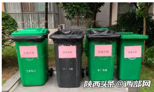
图 2 类型不全的分类垃圾桶

1.从我们日常见到的分类垃圾桶的种类引入讨论，由此加深学生对垃圾分类的印象，提问（2）：看图 2 分析缺少哪种类型的垃圾桶？