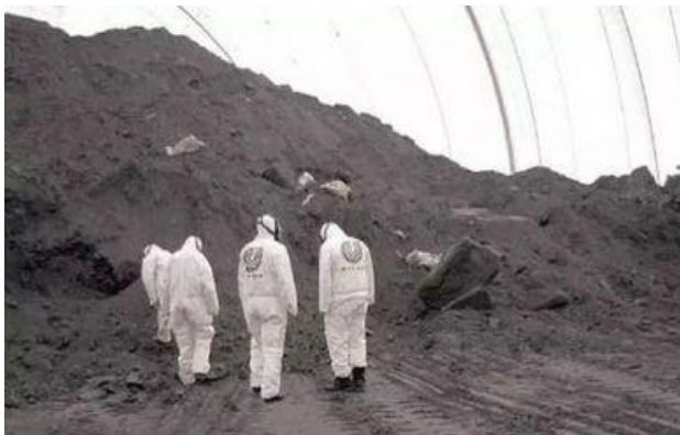
图2 化工厂搬迁产生的毒地