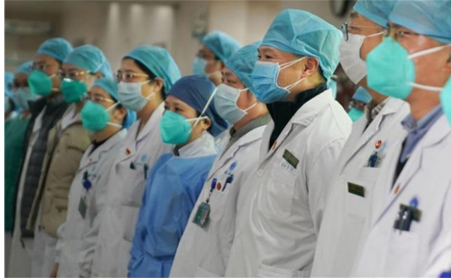
图1 武汉抗疫一线医护人员