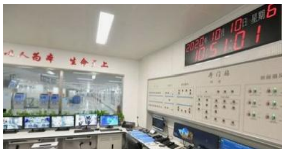
图1 自动监测中控室

2.国家还建立了噪声监测网络,辐射监测网络和区域监测网络等,随着各类环境监测网络的完善,可以说我国已具备较强的环境自动监测能力。教师引导学生从中感悟到中国特色社会主义建设的全面性,增强中国特色社会主义“四个自信”,培养新时代大学生的爱国情、强国志。(来自极目新闻)