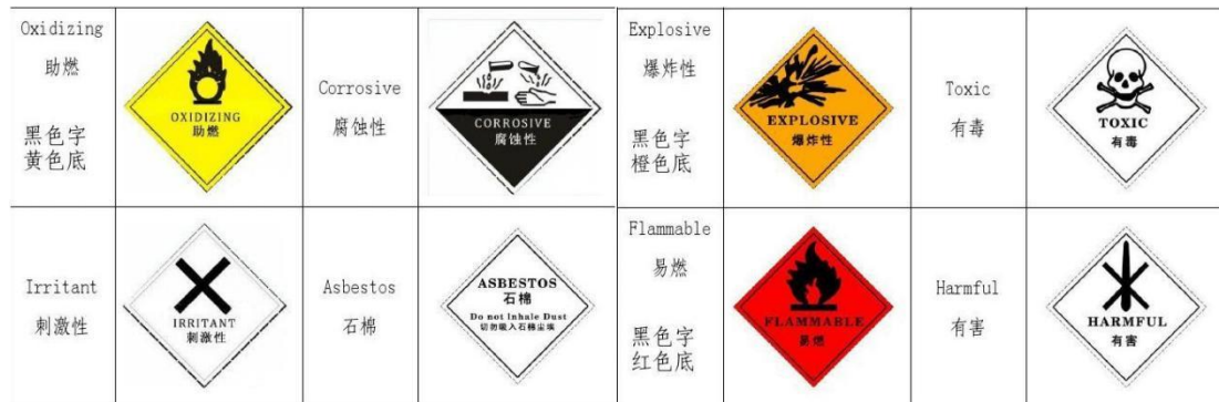
图 1 危险废物识别标志

1.教师在 PPT 上展示危险废物图标，提问（1）：危险废物的定义和分类有哪些？以下图 1 中图标表示什么类型的危险废物？